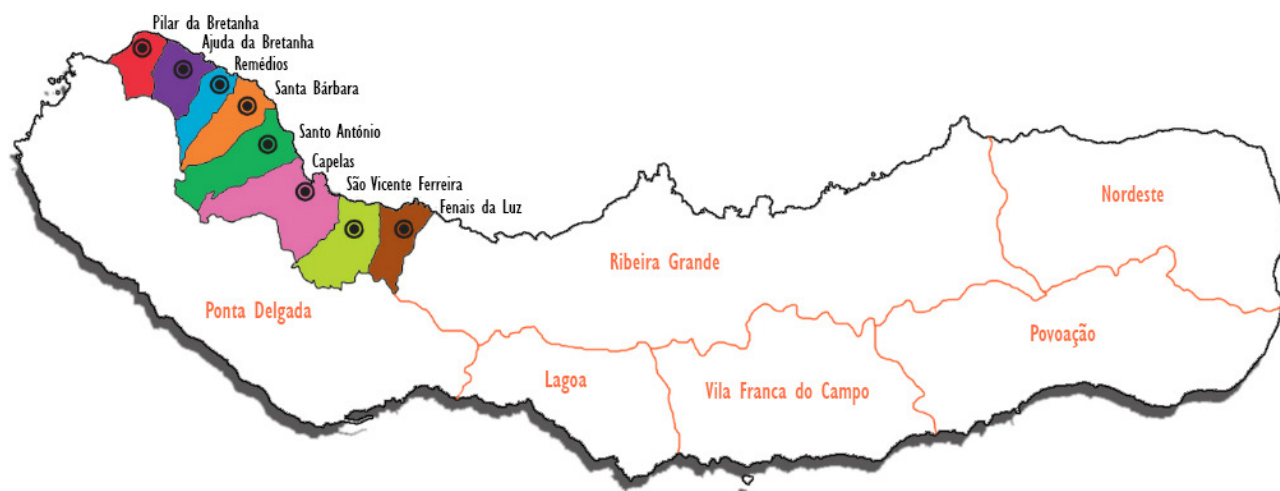
Figura – Mapa do Território de intervenção

A área de intervenção é caracterizada por uma comunidade rural marcadamente isolada em termos geográficos e sociais, afastada dos centros urbanos onde se centralizam os recursos comunitários e sociais. É uma zona composta, maioritariamente por um público jovem, com baixas qualificações, fraco envolvimento com a comunidade escolar, elevada taxa de absentismo, insucesso escolar e consequente desocupação / desemprego que provêm de famílias com múltiplas problemáticas integrantes de um ciclo de pobreza que é importante inverter.